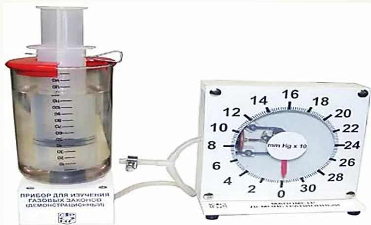
Рис. 3. Прибор для изучения газовых законов демонстрационный