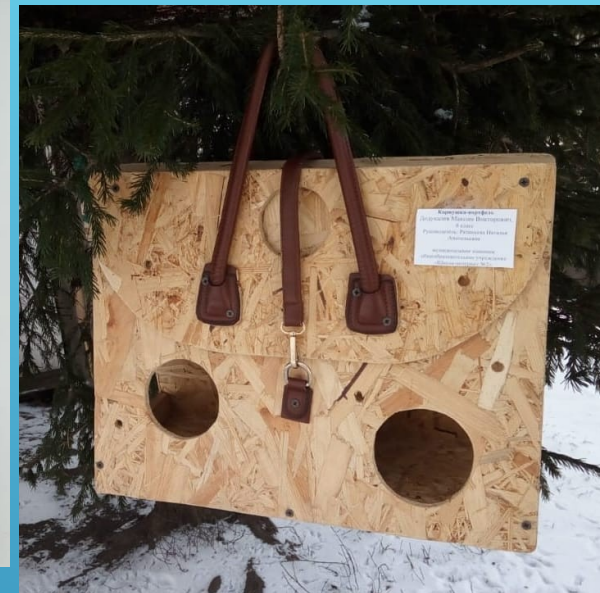
Муниципальное казенное общеобразовательное учреждение «Школа-интернат №2» Киселевского городского округа.